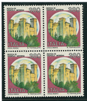
Serie "CASTELLI d'ITALIA" LA ROCCA DI VIGNOLA